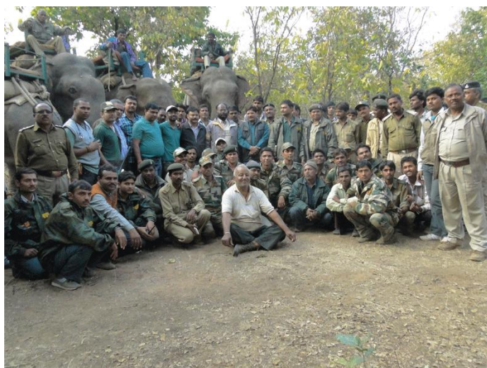
13. Panna-211 capture team.