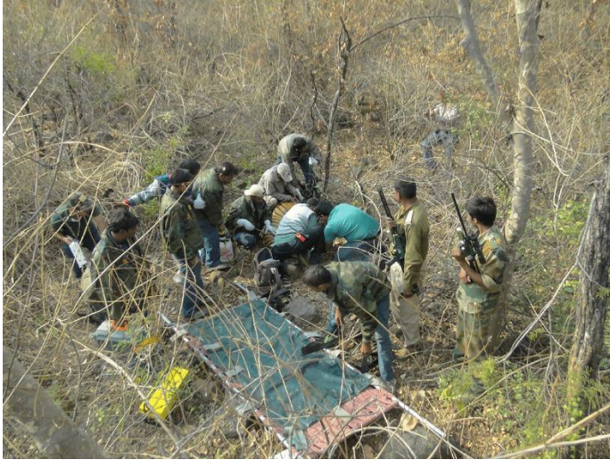
1. Radio collaring and health check up by the technical team