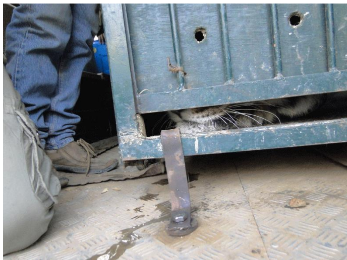
11. Panna-211 in the cage after shifting him to Rescue vehicle