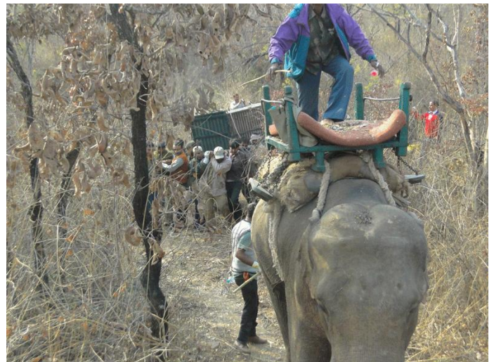
6. Transportation of the cage to tractor trolley.