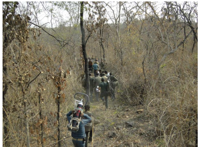
4. Transportation of 211 by stretcher to cage