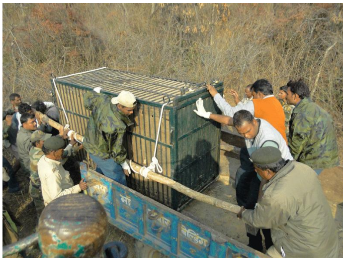
7. Loading the cage in the tractor trolley