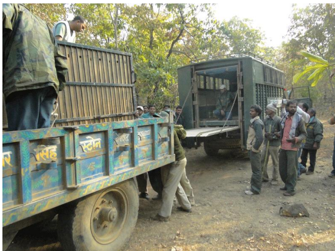
10. Shifting cage from tractor trolley to Rescue vehicle