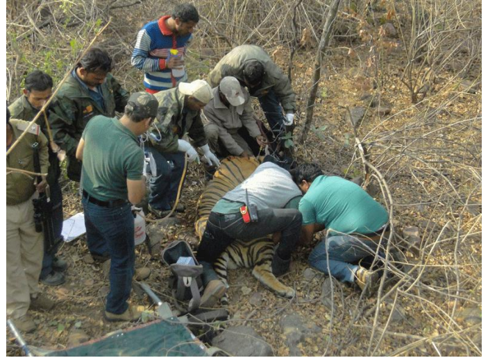
2. Radio collaring and health check up by the technical team