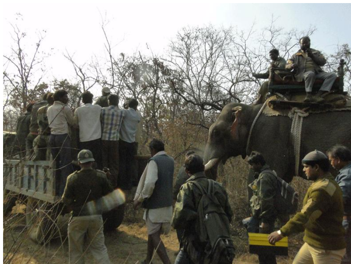
8. Transportation of cage with tractor trolley