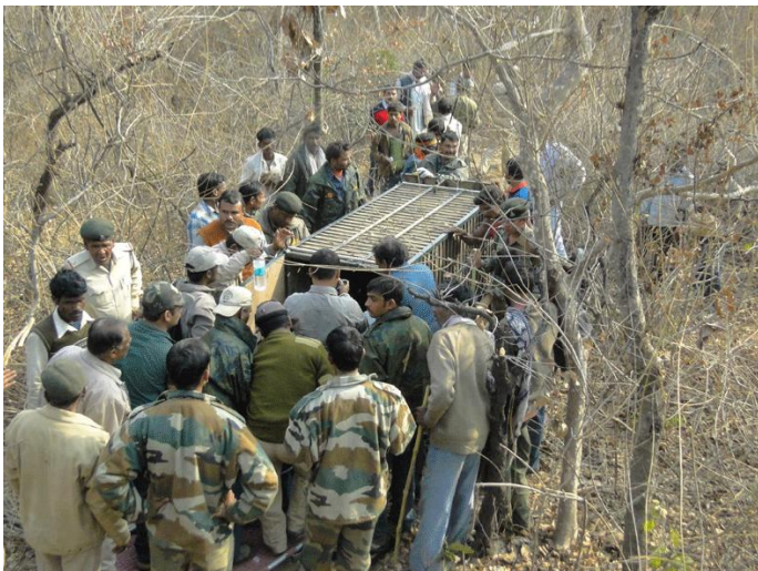
5. Placing the 211 in the cage