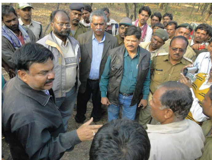
12. Debriefing the team